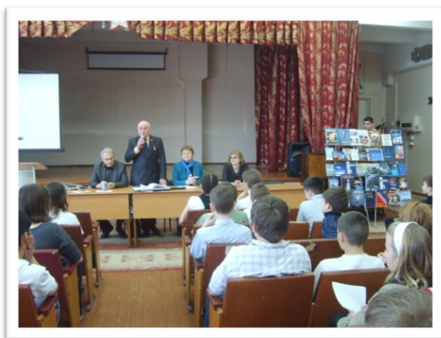
Общешкольная конференция «Гагаринские чтения»