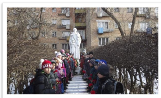
Учащиеся убирают территорию около памятника погибшим во время войны труженикам завода «Металлист» и несут «Вахту памяти»