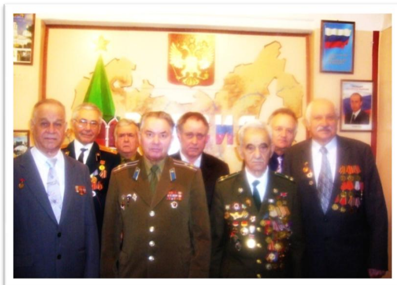
Совет ветеранов Великой Отечественной войны и вооруженных сил в гостях у школьной республики «Спектр»